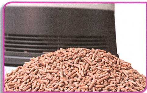
Remplacement ou installation d'un point de chauffage