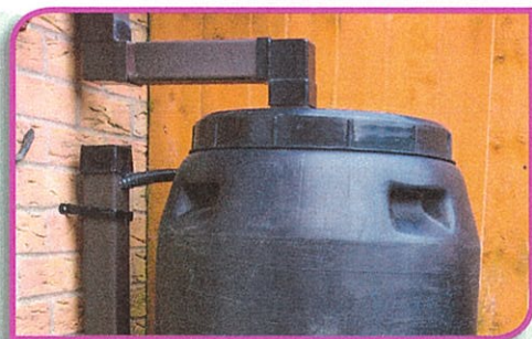
Remplacement du dispositif de collecte des eaux de pluie

Contact utile : l'antenne sociale HP de ma commune ou, s'il n'y en a pas, le référent HP du CPAS.