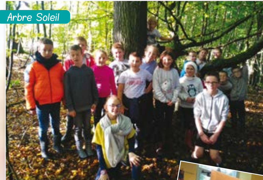
L'arbre à soleil...

Un beau jour humide, les enfants de primaire sont partis dans les bois en « mission de survie ».