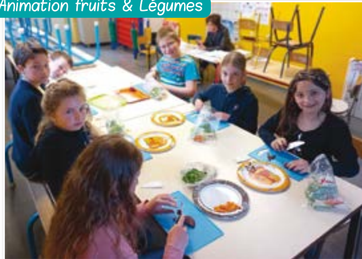
Animation fruits et légumes

Le 11 mai dernier, les élèves de 3e et 4e primaire ont vécu une belle animation sur les fruits et les légumes.