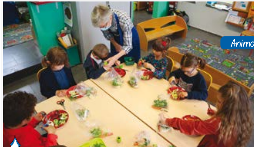
Animation fruits et légumes

Le mardi 11 mai, les moyens et les grands de maternelle ont participé à une animation autour des fruits et des légumes. Les enfants ont pu découvrir ou redécouvrir des fruits et des légumes de nos régions et quelques-uns exotiques. L'activité s'est terminée par la réalisation d'une oeuvre d'art à la manière de d'Archiboldi.